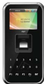
Terminal Biométrico AC-5000 Plus