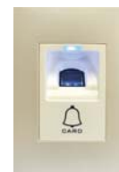
Terminal Biométrico FMD-10