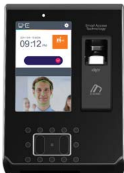
Terminal Biométrico AC-7000

Consulte nosso site e veja a linha completa de produtos.