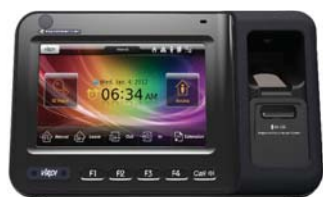
Terminal Biométrico AC-6000